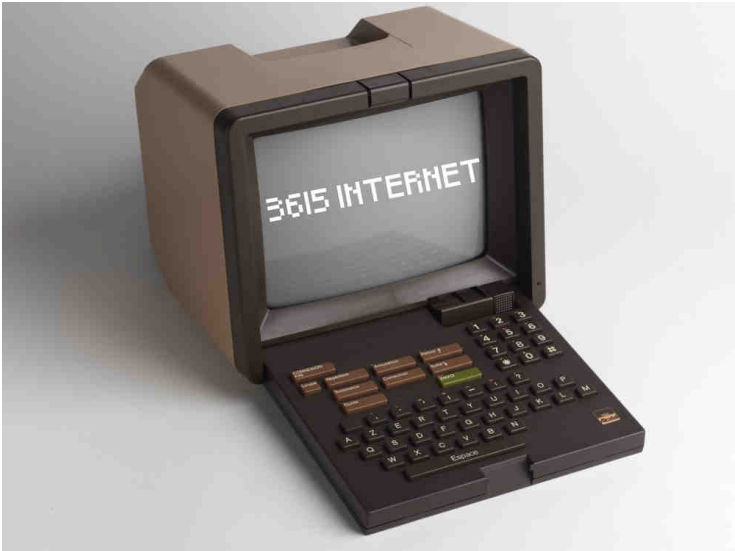
Illustration et fond d'écran

Véritable minitel essayant d'attraper le train d'Internet en marche.